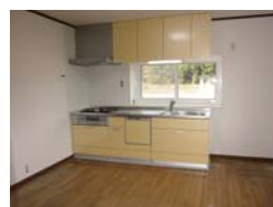
2階ダイニングキッチン